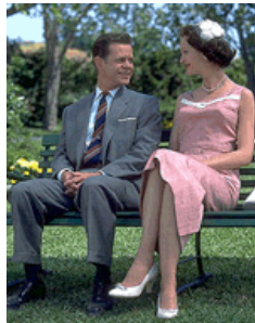
MacUbu - 09:32

Saremo, anzi siamo già, una coppia perfetta.